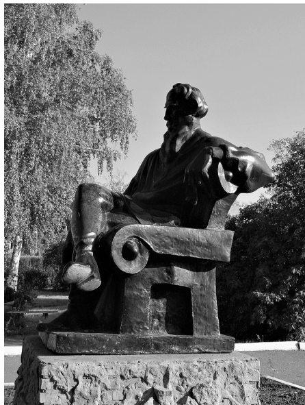
Ил. 2. Памятник Толстому в Бузулуке

вестным причинам прекратил работу над «Декабристами» в феврале 1879 года и направил все свои силы на «Исповедь».