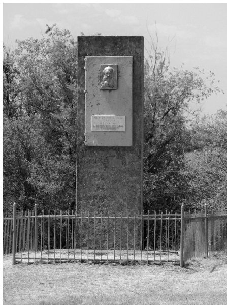
Ил. 1. Памятник на месте второго участка земли Толстого, купленного у Бистрома. Надпись: «На этом месте была усадьба Л.Н. Толстого, в которую он приезжал в 1872—1883»

1829 годов, кампании по подавлению Польского восстания в 1831 году и Крымской войны. Вторым продавцом был Родриг Григорьевич Бистром (1810—1886), помощник главнокомандующего войсками гвардии и Санкт-Петербургского военного округа и член военного совета, отличившийся при подавлении Польского восстания 1863 года (ил. 1) 28 .